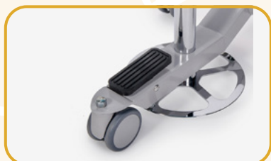
ANELLO PER ALTEZZA VARIABILE